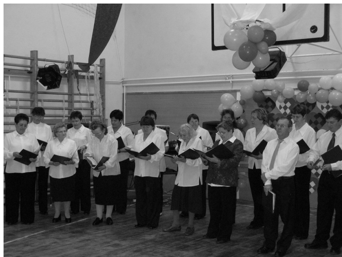
Az iskola bálján fellépett és nagy sikert aratott az újjáalakult prügyi énekkar.