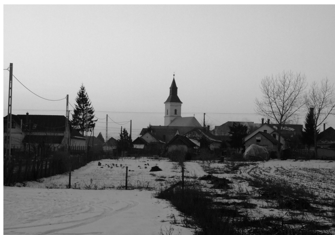
Prügy régi fotókon sorozatunk újabb képe.