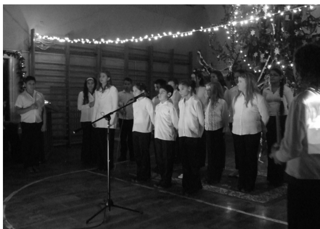
Az iskola karácsonyi rendezvényén készült a felvétel.