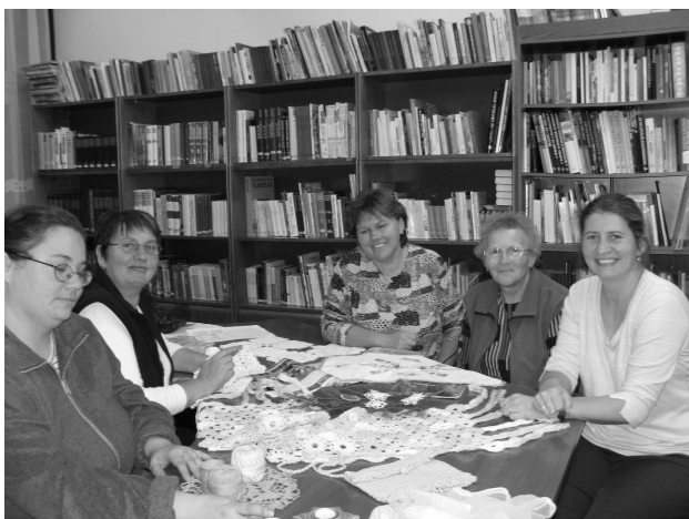
Hímzőszakkör működik az iskolában. Képünk az egyik foglalkozást örkítette meg.