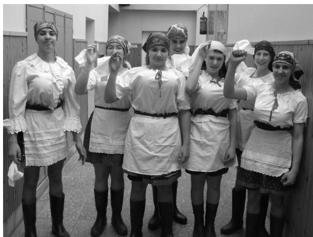
Nagy sikere volt ebben az esztendőben is az iskolai farsangnak. Vidám képünk is ezt igazolja!