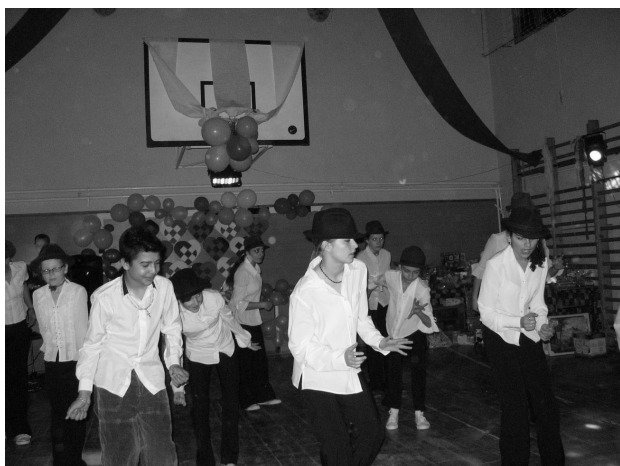
Felvételünk a modern táncsoport iskolai programja közben készült.