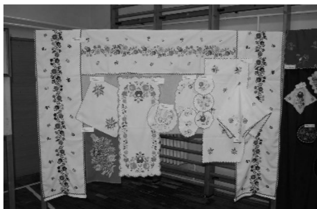
Felső kép: "akik főztek". Alsó kép: "ügyes kezek" munkái.