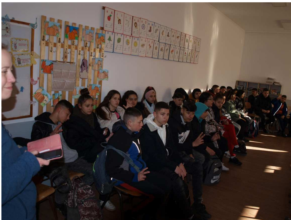
22. kép: Látogatás a Korondi Magyar Nyelvű Általános Iskolában (1)