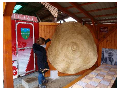
12. kép: Szalmakalap múzeum udvarán találtuk

Az ebédünk elfogyasztása után indultunk Szovátára. Kisebb sétával értünk el a Medve-tóhoz, miközben szakadó hóesés lepett meg minket. A Medve-tó történetével és különlegességeivel ismerkedés közben hógolyó csatát vívtunk a gyerekekkel, mely mindenkit felvidített az itthoni enyhe tél miatt. Túrásunk során megtapasztaltuk az időjárás rendkívül gyors változásait, ahogy a