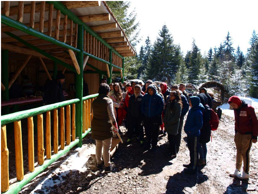
6. kép: Eszternalátogatás ebbédel összekötve