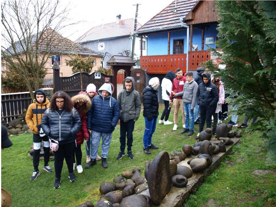
11. kép: Szalmakalap múzeum