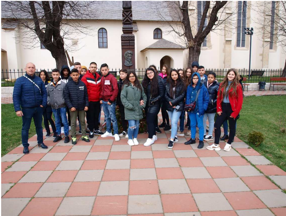
2. kép: Csoportkép Bánffyhunyadon

A pihenő végén tovább utaztunk Korondra a szálláshelyünkre. A szállás elfoglalását követően vacsorázni mentünk, majd a helyiek folklór esttel kedveskedtek érkezésünkre. A folklór esten kezdő rézfúvósok Csillagok háborúja című műve osztatlan sikert aratott, majd helyi Sófalvi néptánc és népdal bemutatót tekinthettük meg. Az estet követően a helyiek kürtőskaláccsal kedveskedtek nekünk.