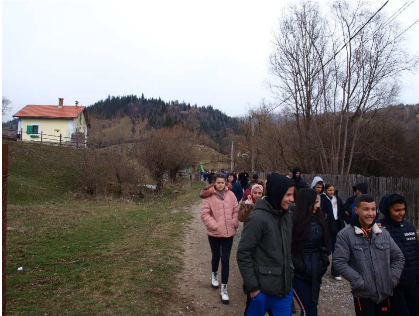
19. kép: Az 1000 éves határárok maradványa napjainkban

A gyárlátogatás során lehetőségünk volt a chips gyártással megismerkednünk, majd mindenki ajándékba kapott chipsszel távozott. Ekkor már nagyon erős északi szél keserítette kirándulásunkat, mely elkísért egészen az 1000 éves határig.