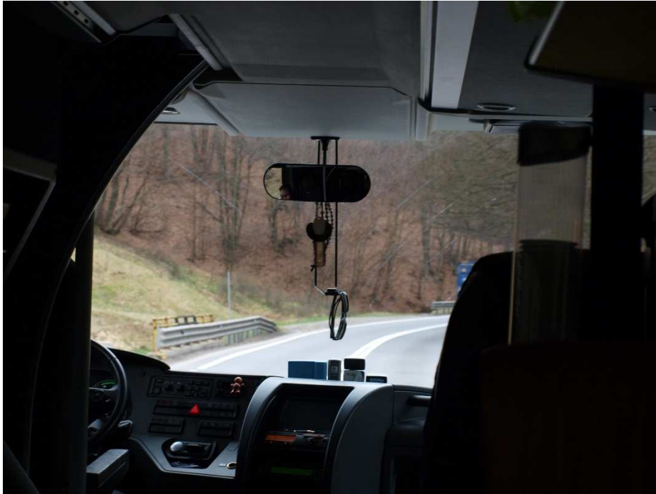
21. kép: Úton a Gyimeseken keresztül

Az 1000 éves határon, Gyimesbükkön megtekintettük az utolsó őrbódét, az abban kialakított múzeumot, majd a kellemetlen időjárás miatt a buszon fogyasztottuk el uzsonnáinkat. Bejártuk a Gyimeseket, több pihenő és séta beiktatásával érkeztünk vissza szállásunkra este. A buszos utazáson a lelki töltődést az autóbuszvezető által lejátszott Bagossy Brothers Company és a 4s Street zenei aláfestés mélyítette el.