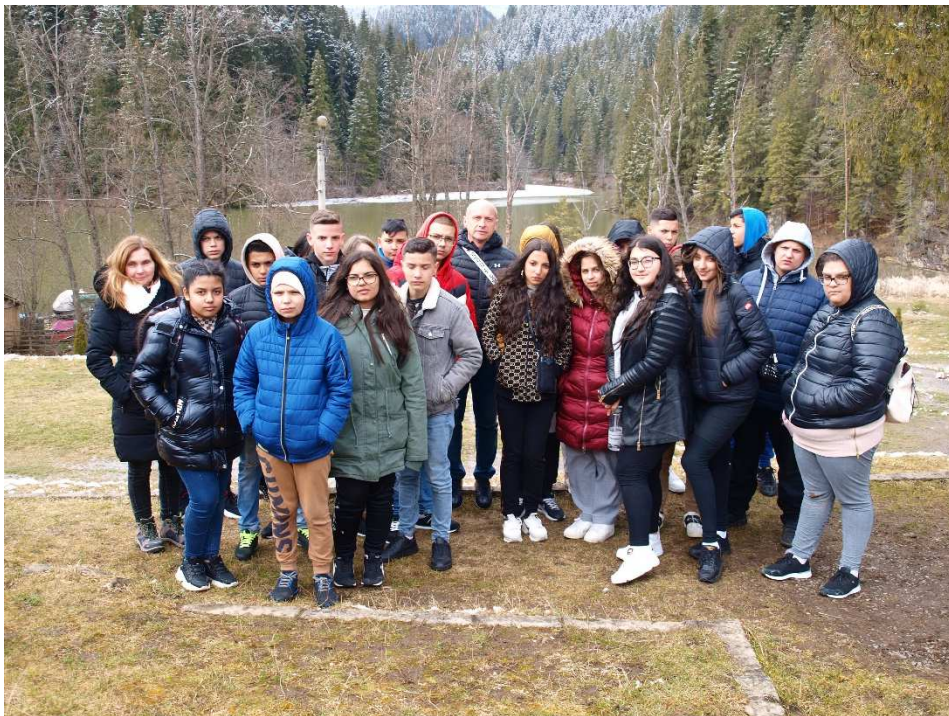
25. kép: Gyilkos tó

Az iskolából a Gyilkos-tó és Békás-szoroson keresztül Pongrácz-tető felé vettük az útirányt. A Gyilkos-tónál megálltunk pihenni, megismerkedtünk a tó történetével és szemtanúi lehettünk a tó pusztulásának folyamatának is. A pihenő után a Pokol-kapuján keresztül értük el a Békás-szorosot, ahol leszálltunk az autóbusról és gyalogosan keltünk át a szoroson. Innen vezetett utunk tovább a csodálatos kilátásáról híres Pongrácz-tetőre, ahonnan gyönyörködtünk a Gyergyói havasok fehérbe borult hegyeiben.