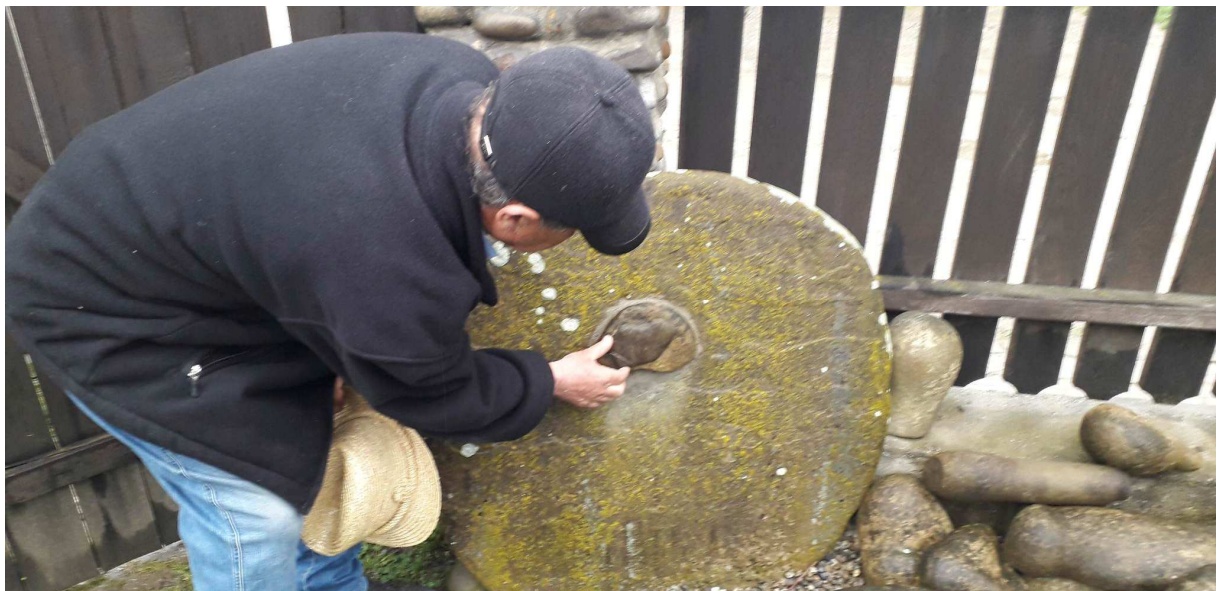
10. kép: Körispatak

Itt először a művelődési házban tartott kézműves foglalkozás keretén belül megismerkedtünk a szalmafonás mesterséggel, mi is különféle fonatokat készítettünk. A fonatokkal való ismerkedés után megtekintettük a híres szalmakalap múzeumot. A múzeum udvarán elfogyasztottuk ebédre kapott frissen sült lángosunk – még választhattunk is többféle ízesítés közül.