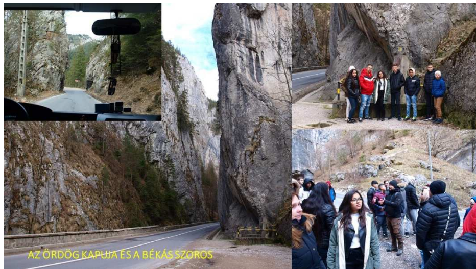
26. kép: Békás-szoros