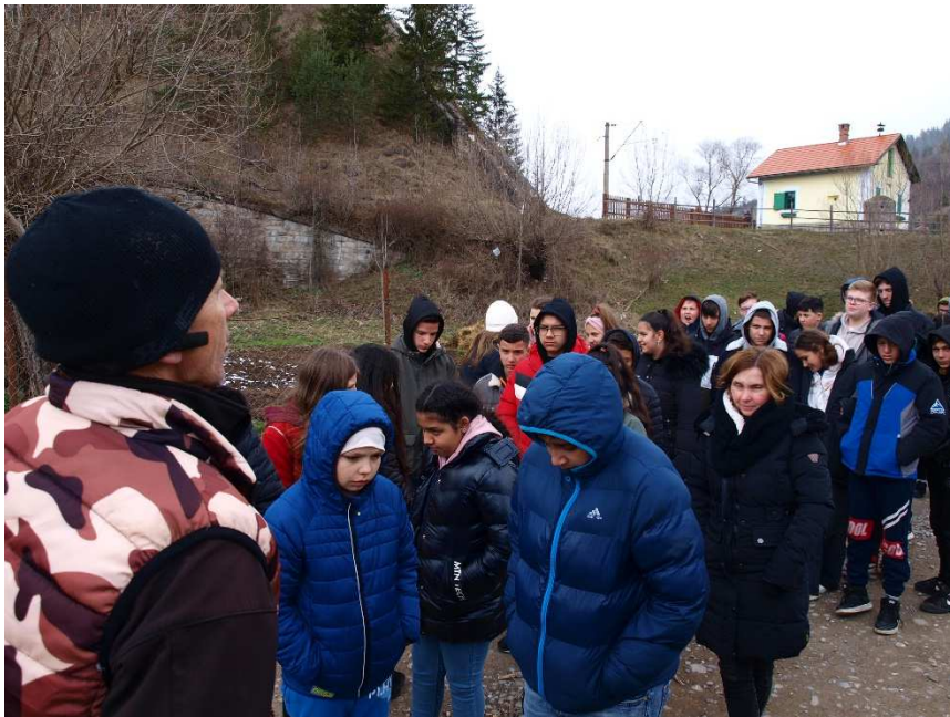
20. kép: Az utolsó vasúti őrbódé az 1000 éves határon