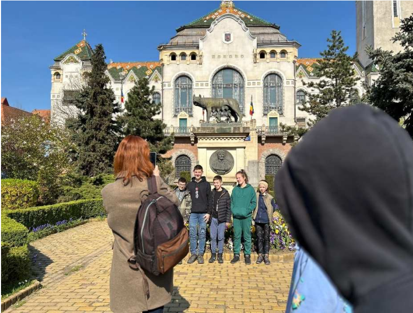
28. kép: Marosvásárhely, Kultúrpalota

órákban. Az iskolánkhöz érve még egy utolsó csoportképet készítettünk, majd a tanulók a szüleikkel hazaindultak. Mindenki nagyon mély érzelmekkel és élményekkel telve ért haza.