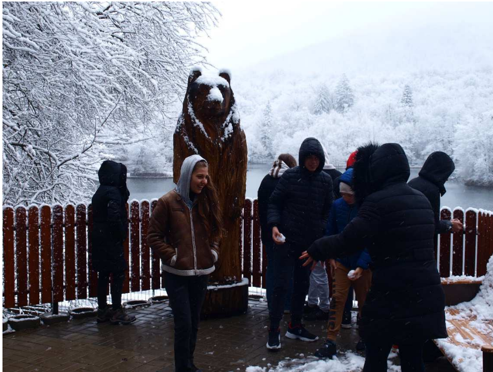
13. kép: Szováta: Medve-tó (1)

Gyimesekből a Csíki vidékre, vagy akár a Gyergyói vidékre átkeltünk a gerinceken. Egyik oldalon ragyogó napsütés, a másik oldalon pár kilométerrel odébb szakadó hóesés fogadott.