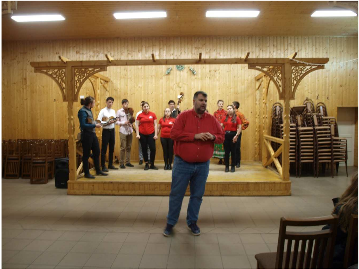
4. kép: Korond folklór est

Második napon a Korondi-fennsíkra látogattunk. A fennsíkra felérve lovasszekérre szálltunk át, amivel a fennsíkot bejártuk. Első utunk a természetjárást követően egy helyi Eszternához vezetett, ahol megismerkedhettünk mit is jelent az „Eszterna” szó. Itt fogyasztottuk el ebédünket, mely helyi sütésű pityókás kenyér, sertészsír, lilahagyma, lekvár, vajból állt.