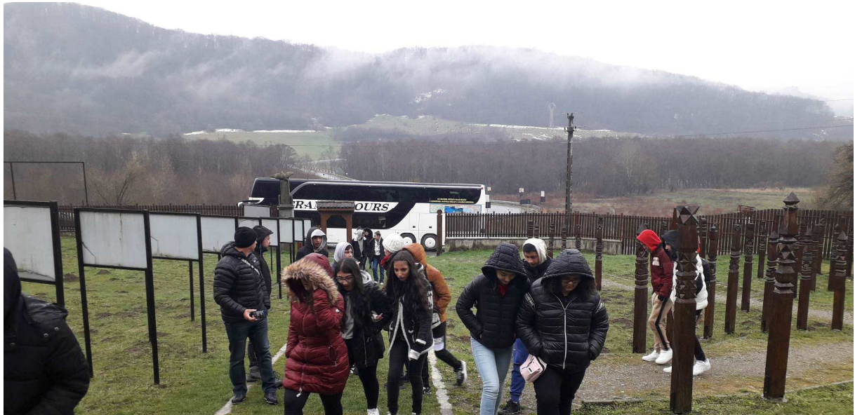
10. kép: Bözödújfalú

Harmadik napon reggelit követően buszra szálltunk és elindultunk megtekinteni az elárasztott falut, Bözödújfalut. A kopjafa parkban leróttuk kegyeletünket, majd tovább utaztunk Körispatakra.