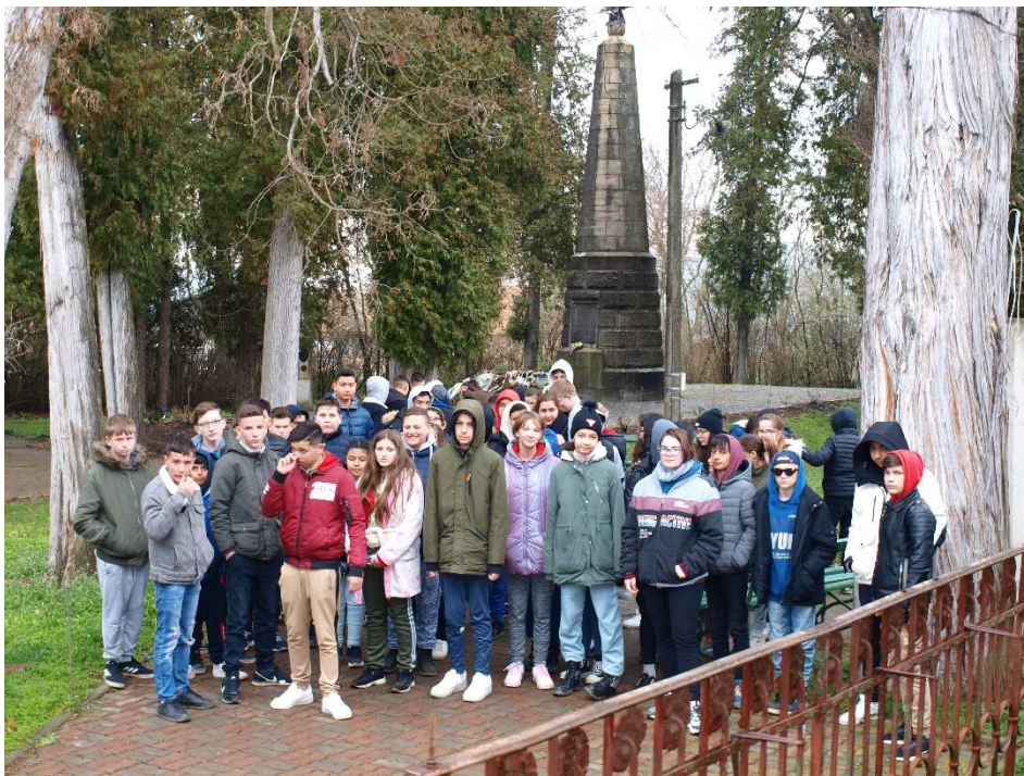
16. kép: Fehéregyháza: Petőfi Sándor emlékmúzeum