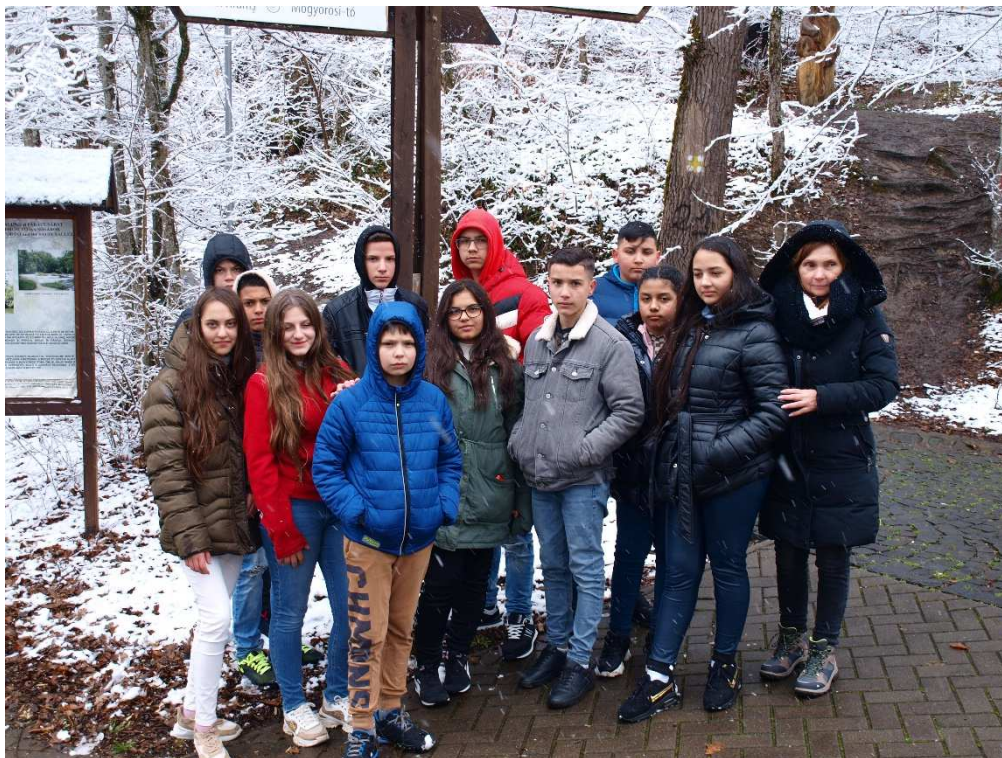
14. kép: Szováta Medve-tó (2)