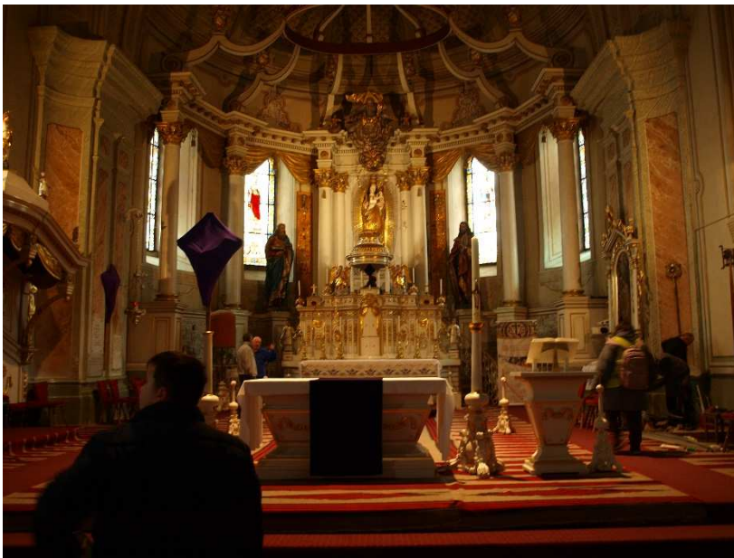
18. kép: Csíkszereda kegytemplom

A koszorúzáskor már ragyogó napsütés fogadott. Innen Székelyudvarhelyre utaztunk, majd Csíkszereda kegytemplom és Csíkszentsimon útvonalon jutottunk el a Csiki Chips gyárba. A gyárban nem tudtunk fényképeket készíteni, mert tiltott volt.