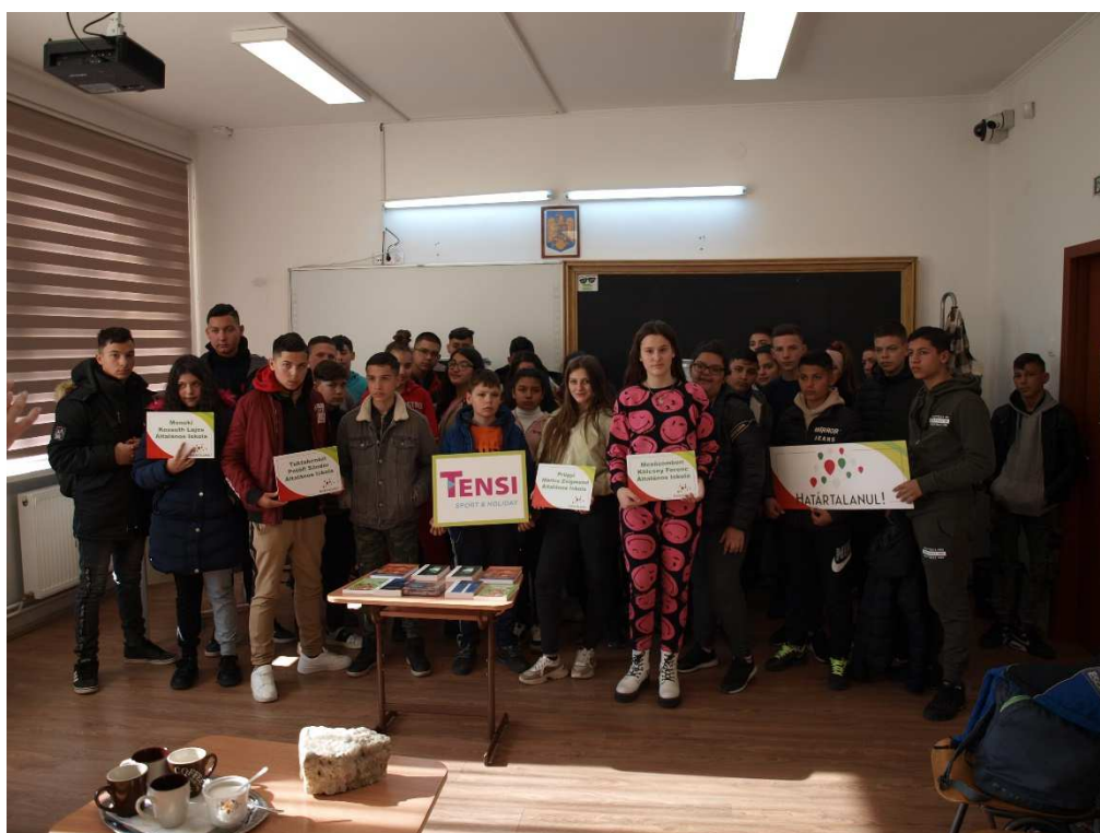
23. kép: Látogatás a Korondi Magyar Nyelvű Általános Iskolában (2)