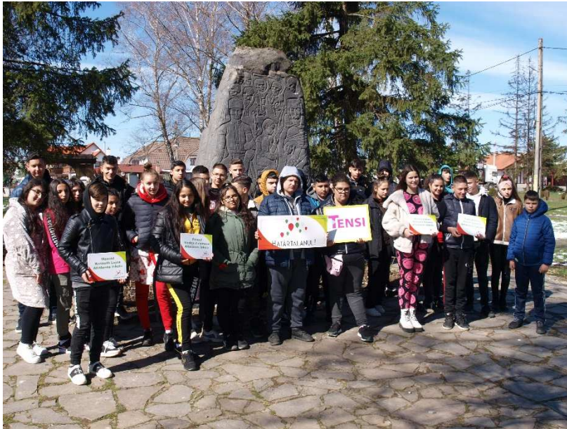
17. kép: Farkaslaka: Tamási Áron

A negyedik napon hosszú út elé néztünk. Első utunk Farkaslakára vezetett, ahol a Székely himnusz közös éneklése mellett megkoszorúztuk Tamási Áron síremlékét születésének 125. évfordulójára.