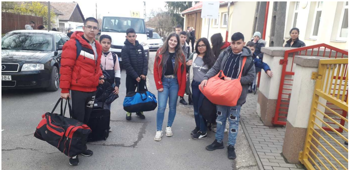
29. kép: Hazaérkeztünk Prügyre