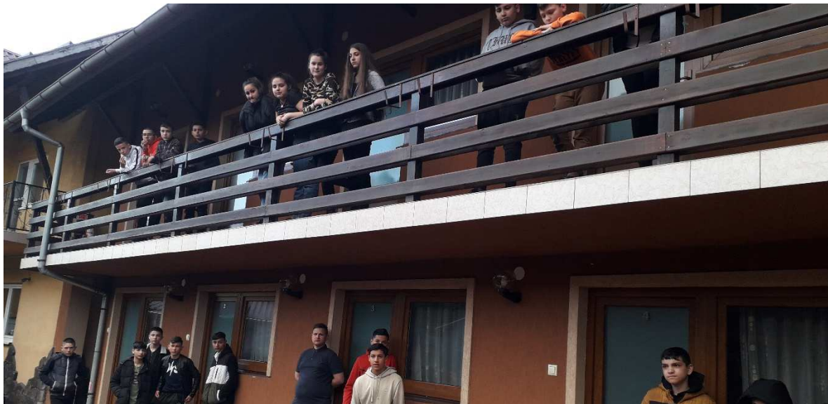
3. kép: Korond szállás

A pihenő végén tovább utaztunk Korondra a szálláshelyünkre. A szállás elfoglalását követően vacsorázni mentünk, majd a helyiek folklór esttel kedveskedtek érkezésünkre. A folklór esten kezdő rézfúvósok Csillagok háborúja című műve osztatlan sikert aratott, majd helyi Sófalvi néptánc és népdal bemutatót tekinthettük meg. Az estet követően a helyiek kürtőskaláccsal kedveskedtek nekünk.