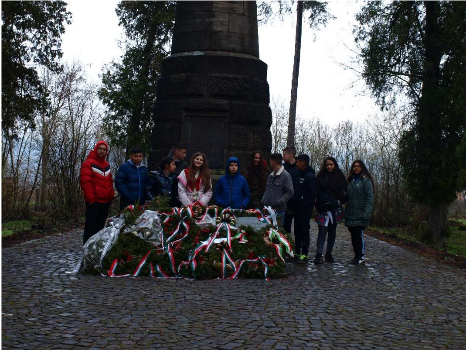
15. kép: Fehéregyháza: Petőfi Sándor emlékmúzeum, koszorúzás

Szovátáról Fehéregyháza felé vettük az irányt. Fehéregyházán a Petőfi Sándor emlékmúzeumba mentünk, ahol megkoszorúztuk a legnagyobb magyar költőnk szobrát. A múzeum gondnoka rendkívül részletesen mesélt a falu határában történt Segesvári csatáról és Petőfi Sándor végnapjairól. Olyan részletekkel is megismerkedhettünk, melyek a történelemkönyvekben nem szerepelnek. Ezt követően megtekintettük az Ispán kutat, ahol Petőfi Sándort utoljára élve látták.