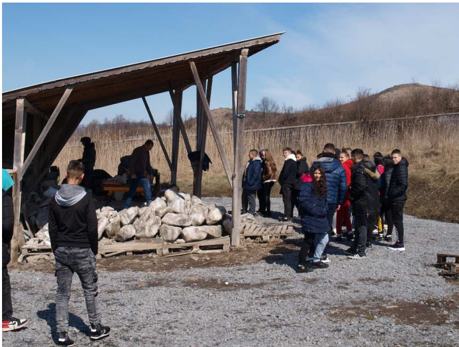
9. kép: Parajdi sófeldolgozás

A napunk olyan gyorsan elszállt, hogy késő délutánra járt az idő, mire eljutottunk a Parajdi sófeldolgozóba. A sófeldolgozóban megtekinthettük a sófeldolgozás minden módját (durva és finomra őrölt étkezési só, emléktárgyak, sólámpa előállítását). Itt mindenki kapott ajándékba 1 kg sót. A nap végén visszatértünk szállásunkra, ahol a vacsorát követően a fáradtságtól mindenki nagyon hamar állomba merült.