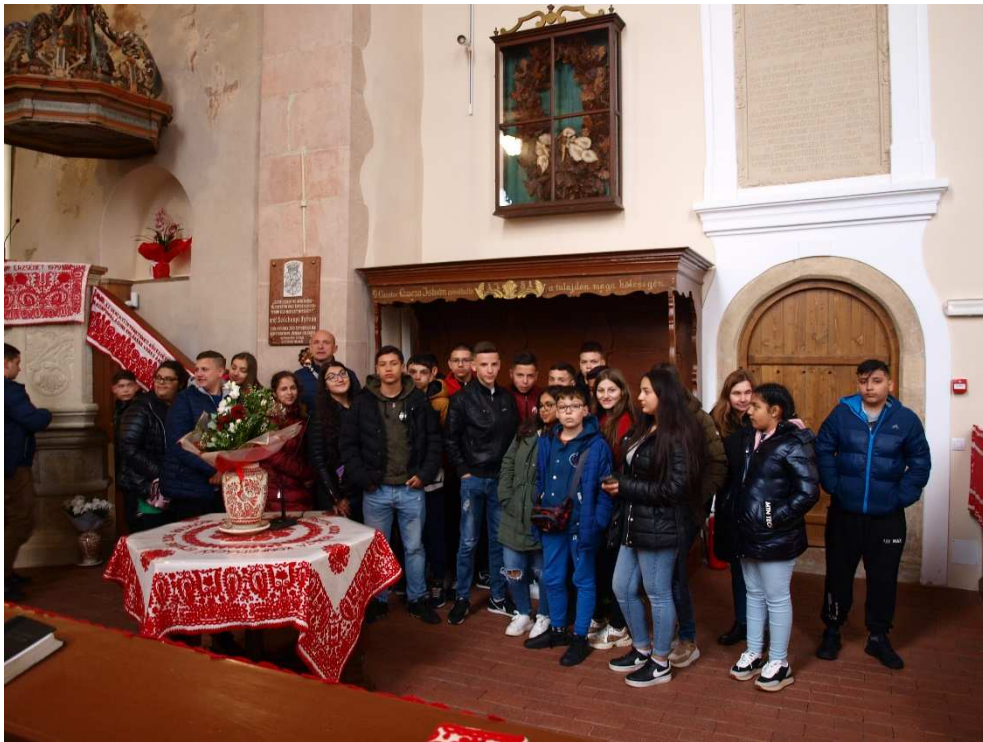
1. kép: Bánffyhunyard református templom

Elérkezett 2023. március 27. reggele. Korán reggel, 5:00-kor indultunk Prügyről, majd Taktakenézen csatlakoztak hozzánk útitársaink. Debrecen érintésével értük el a Nagykereki határátkelőt, ahonnan kisebb várakozást követően folytattuk utunkat Bánffyhunyard felé, ahol nagyobb pihenőt tartottunk. A pihenő során megtekintettük a Bánffyhunyard főterén álló református templomot, remek idegenvezetőnknek köszönhetően megismerkedhettünk a település és a templom, illetve a gyülekezet történelmével is.