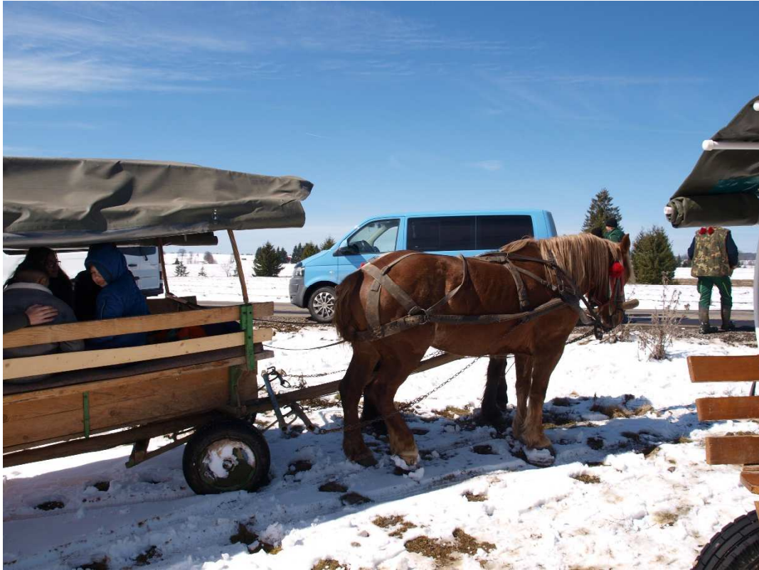
5. kép: Lovasszekérrel a fennsíkon