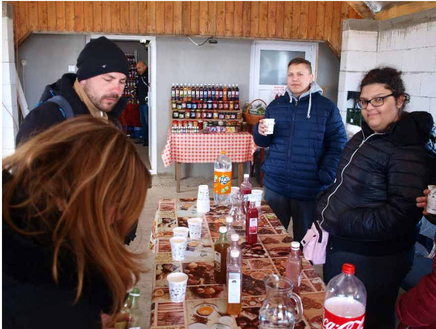
8. kép: Szörp és lekvárkészítés az Eszternán

A napunk olyan gyorsan elszállt, hogy késő délutánra járt az idő, mire eljutottunk a Parajdi sófeldolgozóba. A sófeldolgozóban megtekinthettük a sófeldolgozás minden módját (durva és finomra őrölt étkezési só, emléktárgyak, sólámpa előállítását). Itt mindenki kapott ajándékba 1 kg sót. A nap végén visszatértünk szállásunkra, ahol a vacsorát követően a fáradtságtól mindenki nagyon hamar állomba merült.