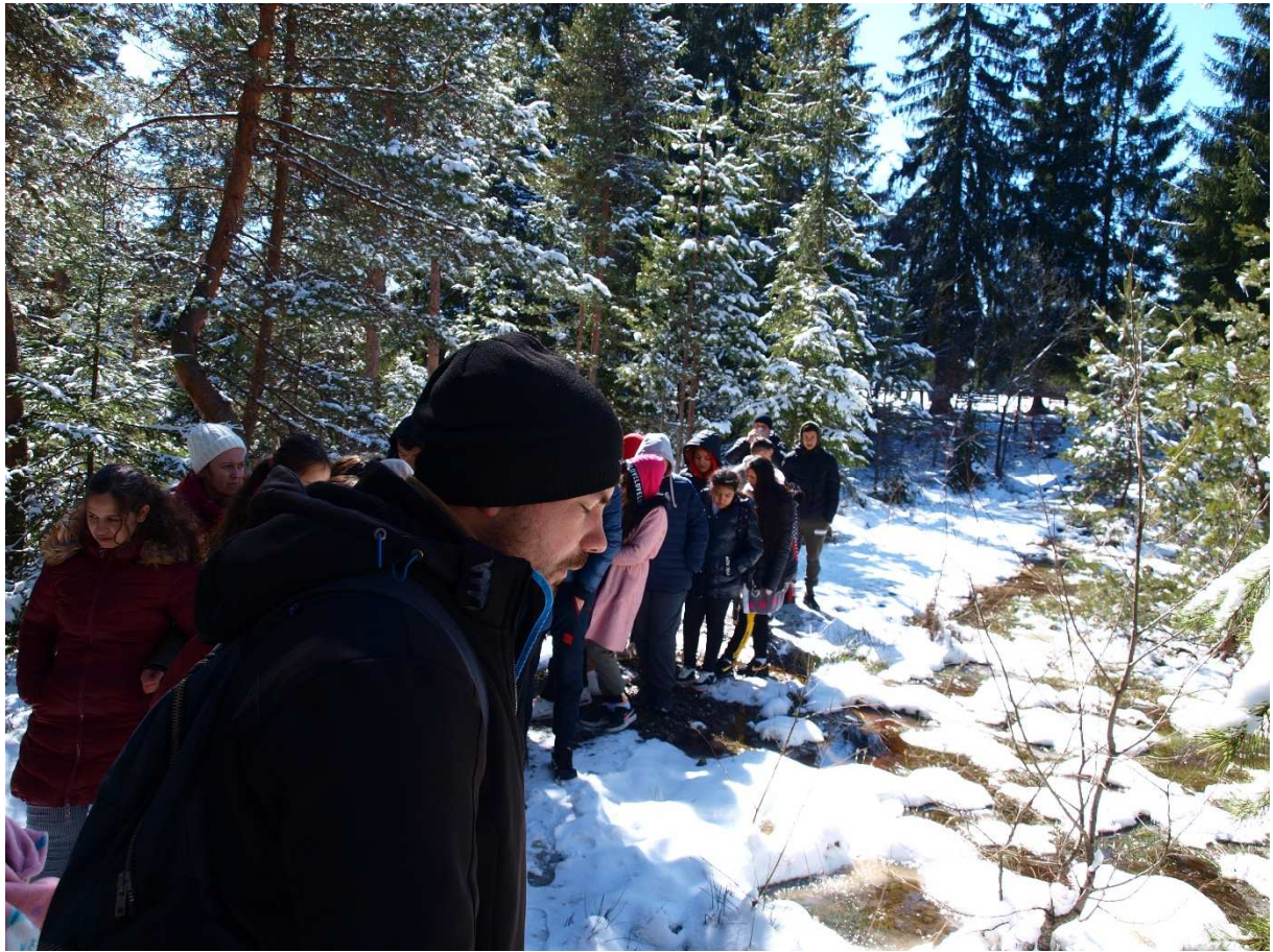
7. kép: Korondi tőzegláp

Az ebéd elfogyasztása után újra szekérre szálltunk és megtekintettük a helyi természetvédelmi területet (tőzeglápot), ahol a tőzegáfonya honos, innen további eszternákat látogattunk meg, ahol lekvár, szörp, illetve gyógyteák készítésével foglalkoznak. Természetesen mindenhol nagy szeretettel fogadtak és bőségesen elláttak minket kóstolóval is.